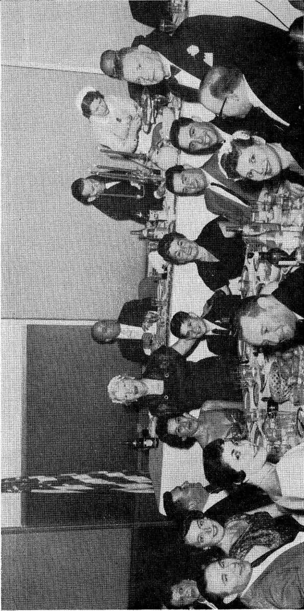
איך מיט מיין פאמיליע, פרוי, זון, טעכטער, אידעמס און שוורן ביים באנקעט פון מיין יוניאן לכבוד מיר, 1954